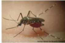
Aedes aegypti +++